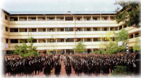
Jyothi Nikethan II